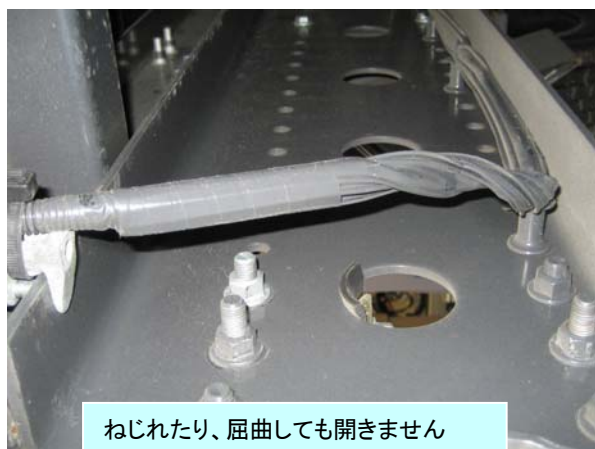
ねじれたり、屈曲しても開きません